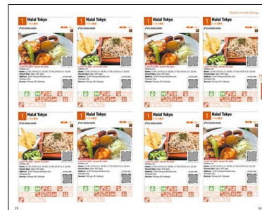
中面・飲食店ページ（イメージ）